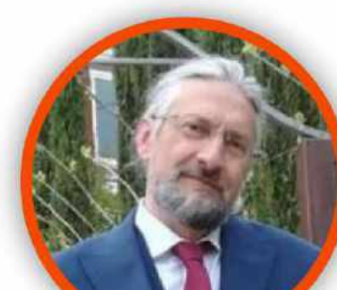
MASSIMO TAVOLA SECONDARIA DI PRIMO GRADO