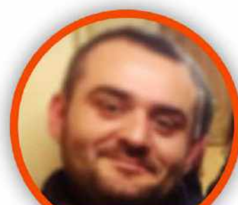
ROBERTO ZOLLO SCUOLA PRIMARIA