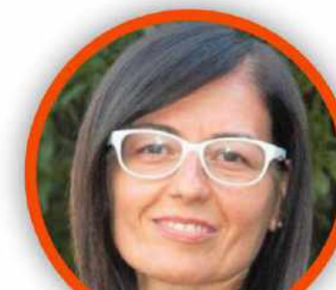
MARIE ANNA FEBBRAIO SECONDARIA DI PRIMO GRADO