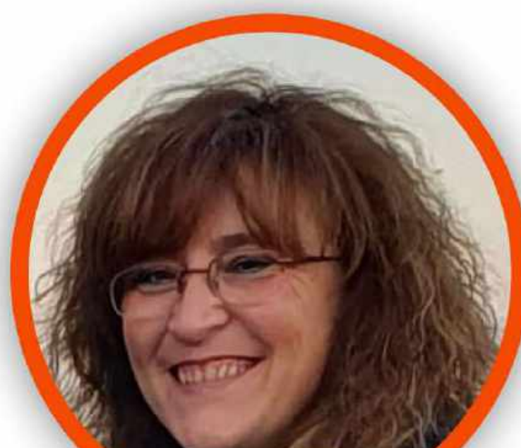
MARIANGELA MAPELLI SCUOLA PRIMARIA