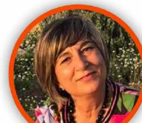
GIOVANNA MARIA BURRELLI SCUOLA PRIMARIA